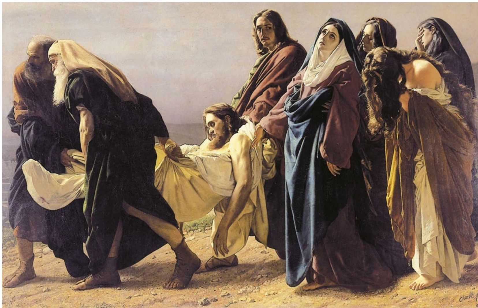
Il trasporto di Cristo al sepolcro

Nel 1919 la Confraternita di San Rocco commissionò allo scultore leccese Raffaele Caretta una statua il cui soggetto raffigurasse il trasporto di Gesù nel sepolcro.