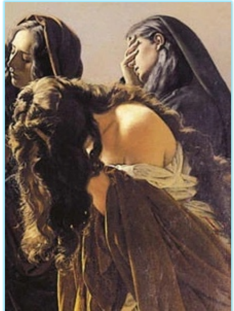
Il trasporto di Cristo al sepolcro -1883-